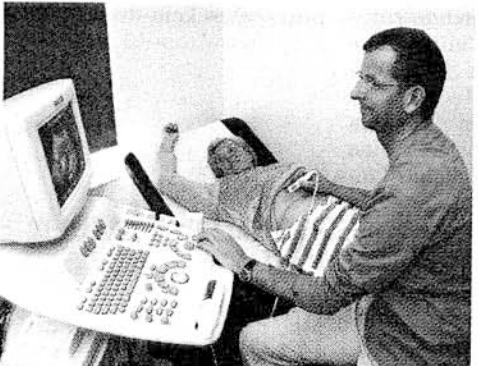
Dr. Halle führt eine Ultraschall-Untersuchung durch