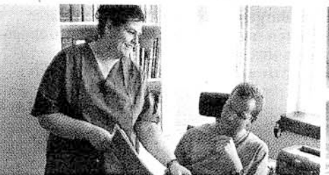
In der neuen Facharztpraxis steht das Wohl des Patienten an erster Stelle