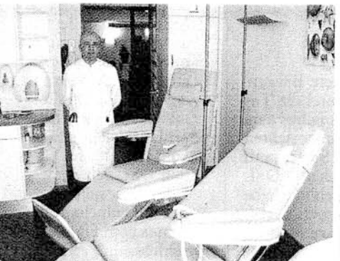
Modern eingerichtet ist die Infusionszone